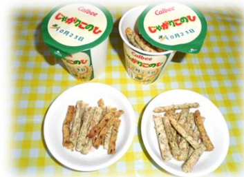
じゃがりこ風ポテト